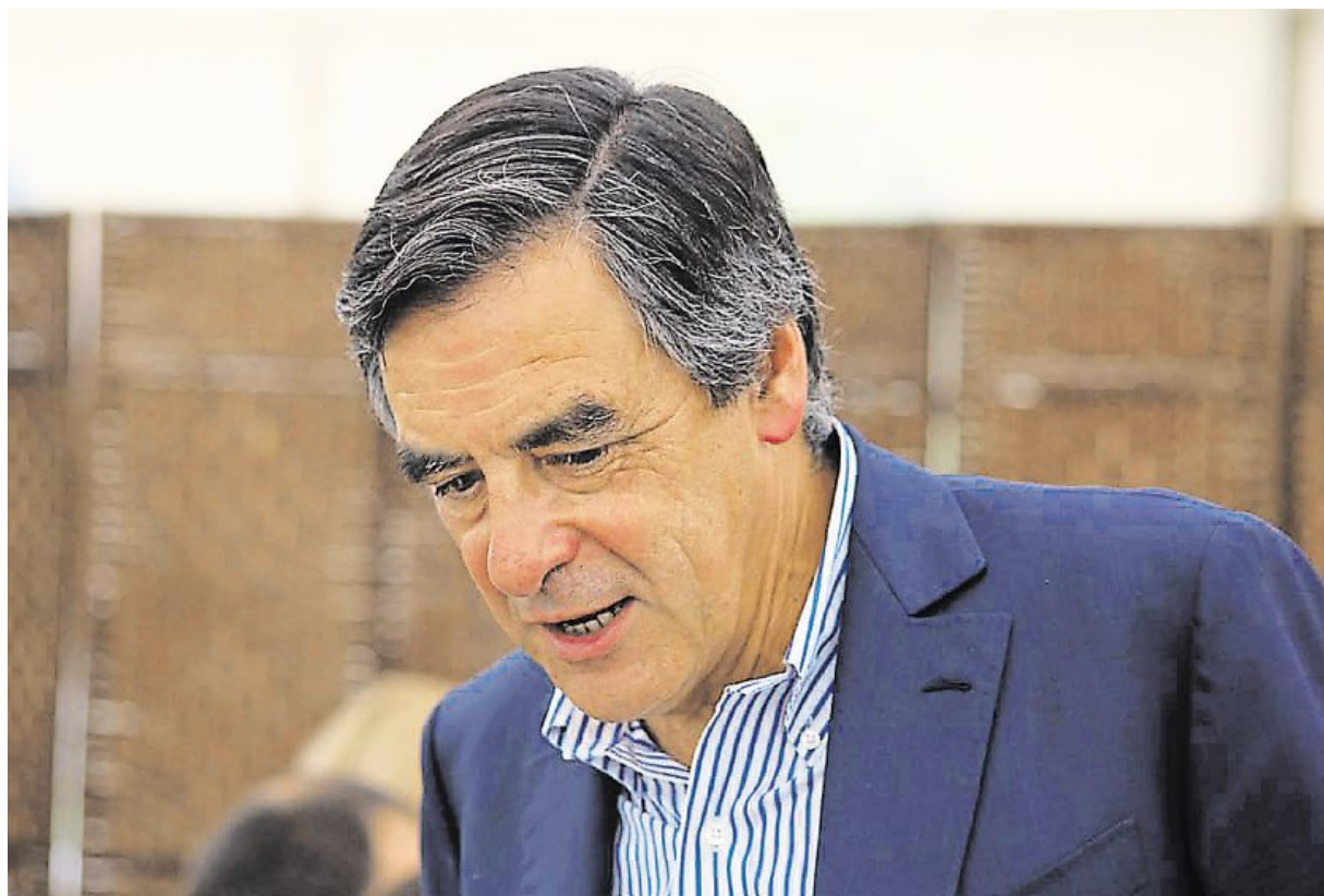
François Fillon s'engage dans la course à la primaire à droite. Il a la certitude de bénéficier d'un atout : « celui de ne pas être considéré comme un homme qui parle en l'air ».

paillettes. « Je suis un homme de l'Ouest avec des valeurs, un homme réservé qui pense que la politique n'est pas du spectacle. Je n'ai jamais totalement réussi à le faire comprendre, non pas à mes électeurs, mais à ceux qui observent la vie politique », a-t-il expliqué à nos confrères de l'hebdomadaire Le Point cette semaine.